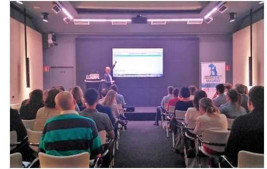
Diseño de eventos para Health 2.0 Madrid

Dermatología para la formación de profesionales médicos.