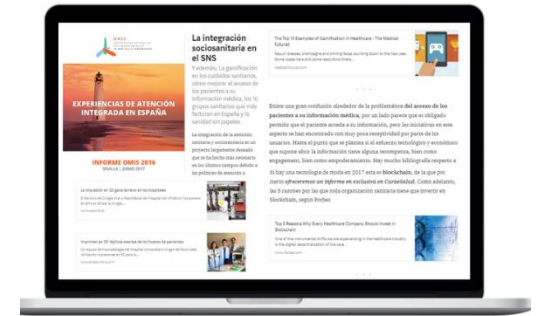
Información semanal de valor y relevancia

Realizamos charlas divulgativas sobre tecnologías y tendencias.